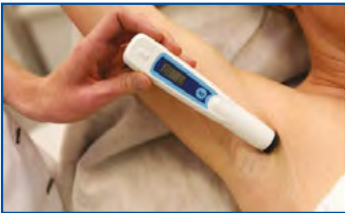
1. Melanin-Meter auf der Haut platzieren