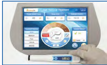
2. Wert im Gerät einstellen